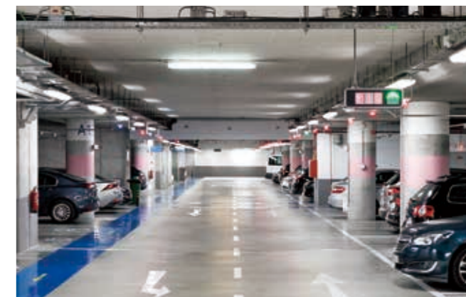
自走式(平面)駐車場